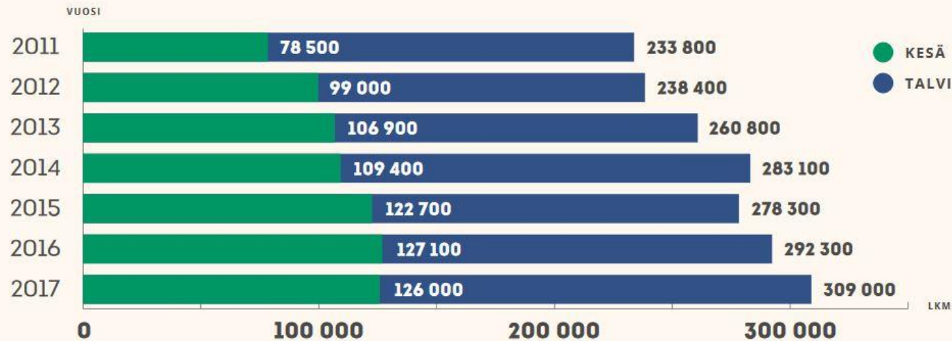
Pallas-Yllästunturin kansallispuiston eteläpään kävijämäärät